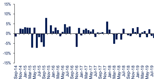
Kinerja Bulanan Selama 5 Tahun Terakhir